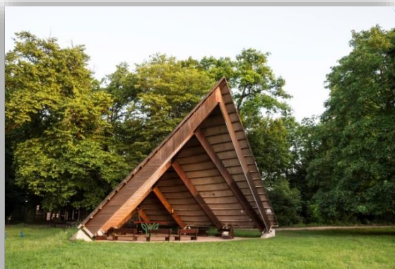
Chapelle pionniers, Jambville (78)